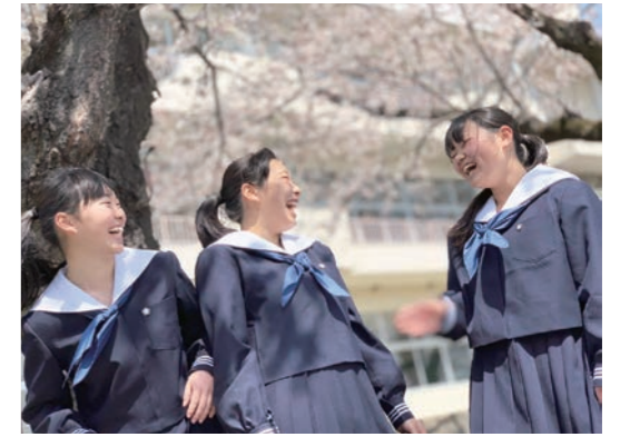
2021 マイハビネスフォトコンテスト 応募作品「新しい門出」(鈴木さとみさま・栃木県)

明治安田生命保険相互会社 〒100-0005 東京都千代田区丸の内2-1-1 www.meijiyasuda.co.jp